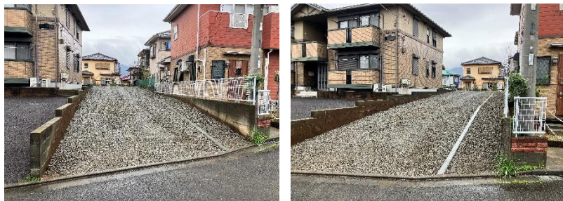
前面道路公道幅員4.7m 接道約4mです