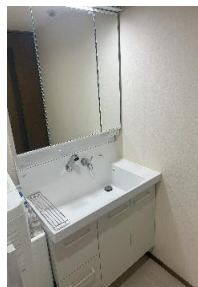
広めの洗面台、綺麗な浴室、快適な手洗い付き広タトイレ♪