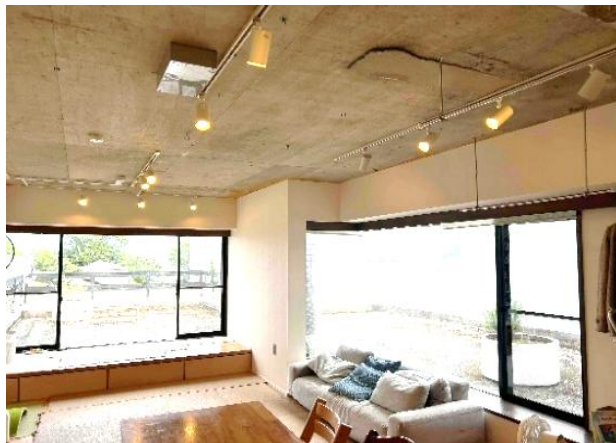
ダウンライトやコンクリ天井が大変おしゃれなリビングダイニングです♪