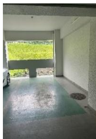
屋内ガレージ付き！