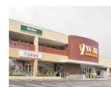
ヤオコー徒歩圏内