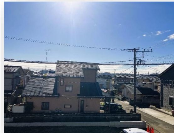
◆2階からの眺望良好◆