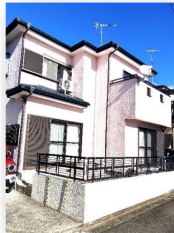
◆お庭スペースあります◆

新東名秦野ICまで 🚗 で8分！ 都心へのアクセス良し！ 県立戸川公園まで 🚗 で4分！ BBQ場あり！川遊びもできます！ 屋根、外壁、浴室、室内建具等リフォーム済♪すぐに新生活できます！