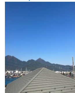
2階窓からの眺め♪丹沢の稜線と富士