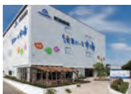
住まいの総合ショールーム 住まい・る市場

県内最大規模の住まいのショールーム「住まい・る市場」とモデルハウスをまとめてご覧いただけます。ご家族皆さままで、是非ご来場ください。