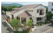
南欧風のたたずまい モデルハウス「ラ・ミア・カーサ」